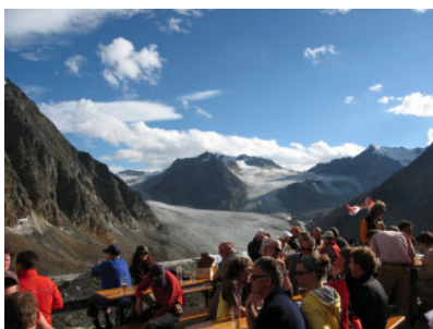
Braunschweiger Hütte und Mittelbergferner

Von Zams mit der Venetbahn zum Krahhberg (2208 m) mit umfassendem Rundblick auf die Lech- und Öztaler. Langer Abstieg ins Pitztal und anschließender Aufstieg zur Braunschweiger Hütte (2759 m) mit Blick in die Gletscherwelt der Öztaler Alpen – einer der schwersten Tage!